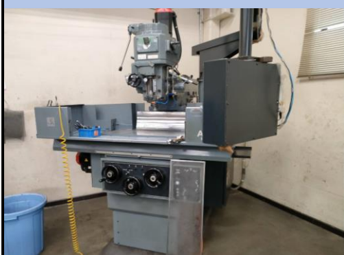
No.30 NCフライス盤 牧野 2008年製 AEV-74型