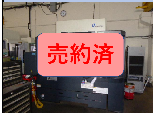
No.13 立型マシニング 牧野 2015年製 V33i型