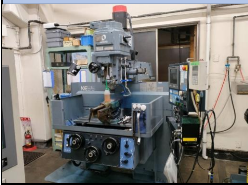
No.5 NCフライス盤 牧野 2018年製 KEV-55型