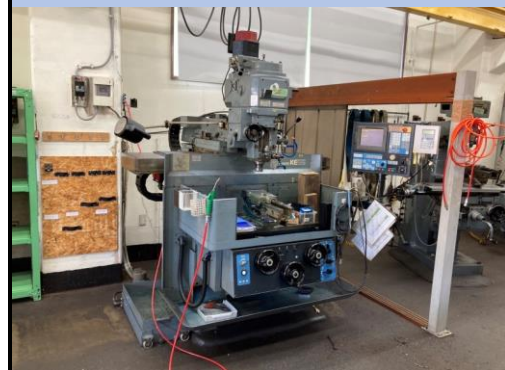
No.25 NCフライス盤 牧野 2010年製 KEVA-55型