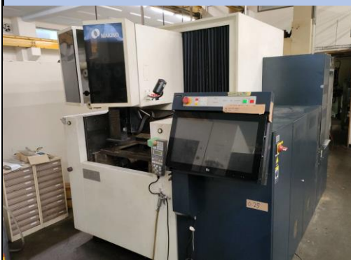
No.9 ワイヤークット 牧野 2016年製 U3型