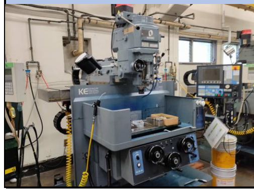
No.4 NCフライス盤 牧野 2018年製 KEV-55型