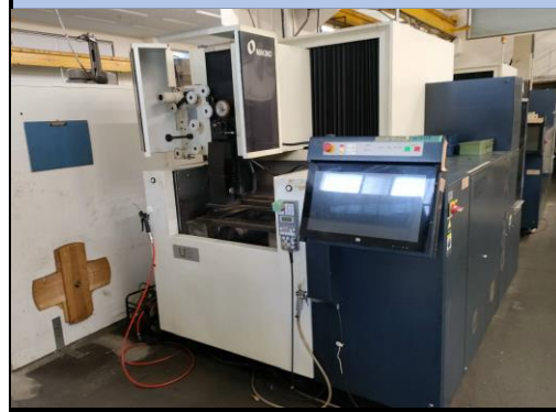
No.8 ワイヤークット 牧野 2016年製 U3型