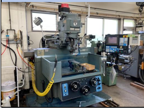
No.3 NCフライス盤 牧野 2004年製 KEVA-55型