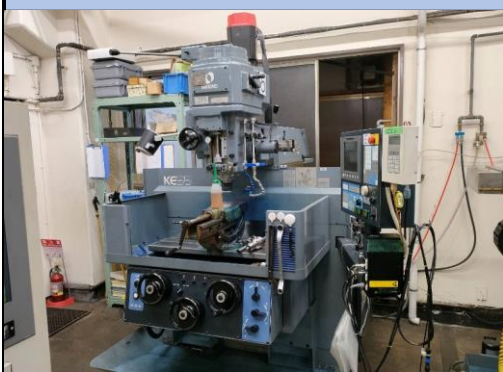
No.5 NCフライス盤 牧野 2018年製 KEV-55型