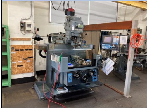
No.25 NCフライス盤 牧野 2010年製 KEVA-55型