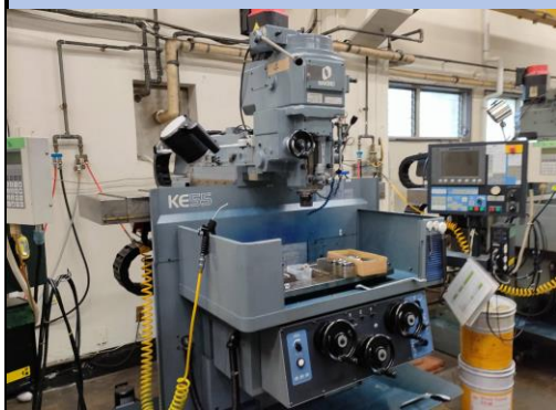
No.4 NCフライス盤 牧野 2018年製 KEV-55型