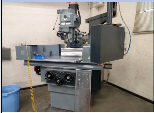
No.30 NCフライス盤 牧野 2008年製 AEV-74型